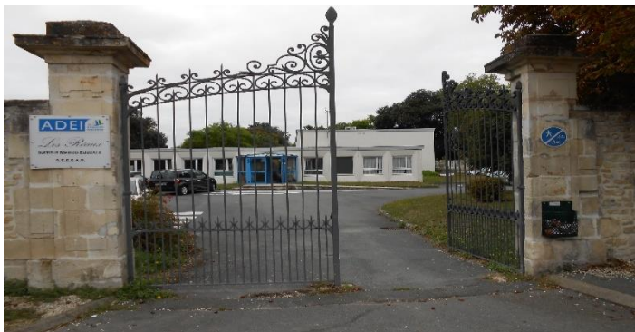
IME de l'Océan site les Réaux à Aytré