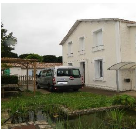
IMPro de l'Océan site de Rochefort