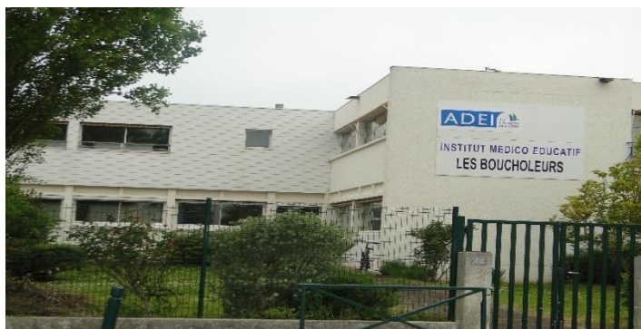
IME de l'Océan site les Boucholeurs à Chatelaillon