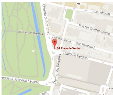
CMPP La Rochelle