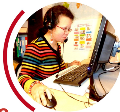
Adaptation, Travail protégé, Insertion sociale

En Etablissement et Service d'Aide par le Travail (ESAT), Entreprise Adaptée (EA)